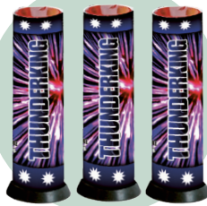
Single shot/ Thunder King