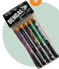
Bengals vuur/fakkel (F1)