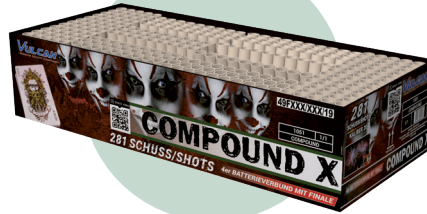
Compound/ samengesteld vuurwerk