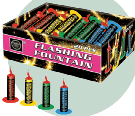
Kleine fontein (F1)